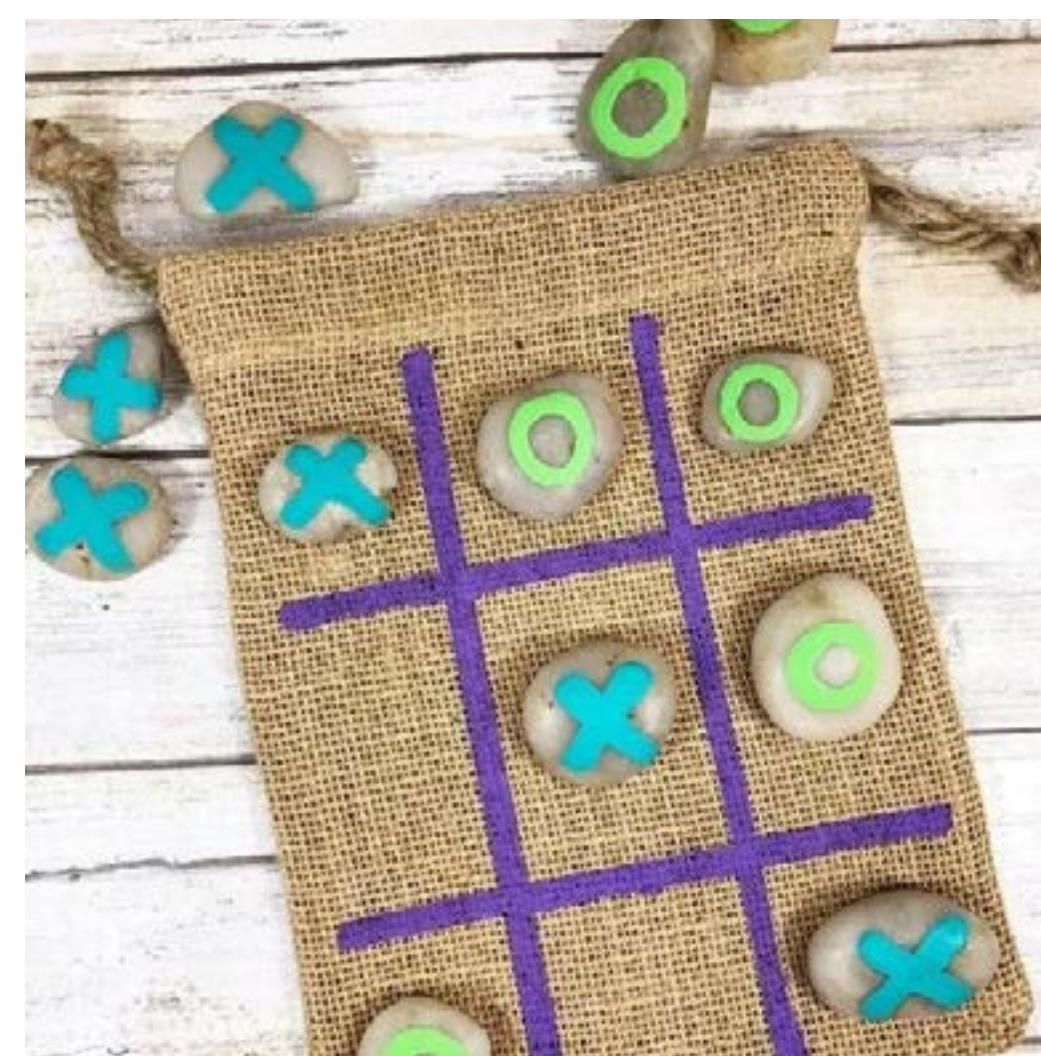
Juego 3 en raya