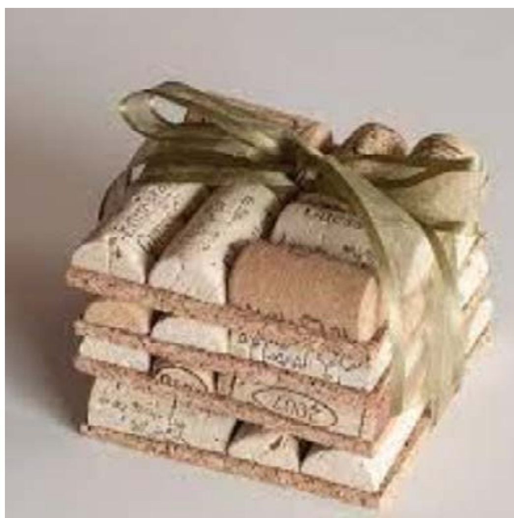
Lote de posavasos