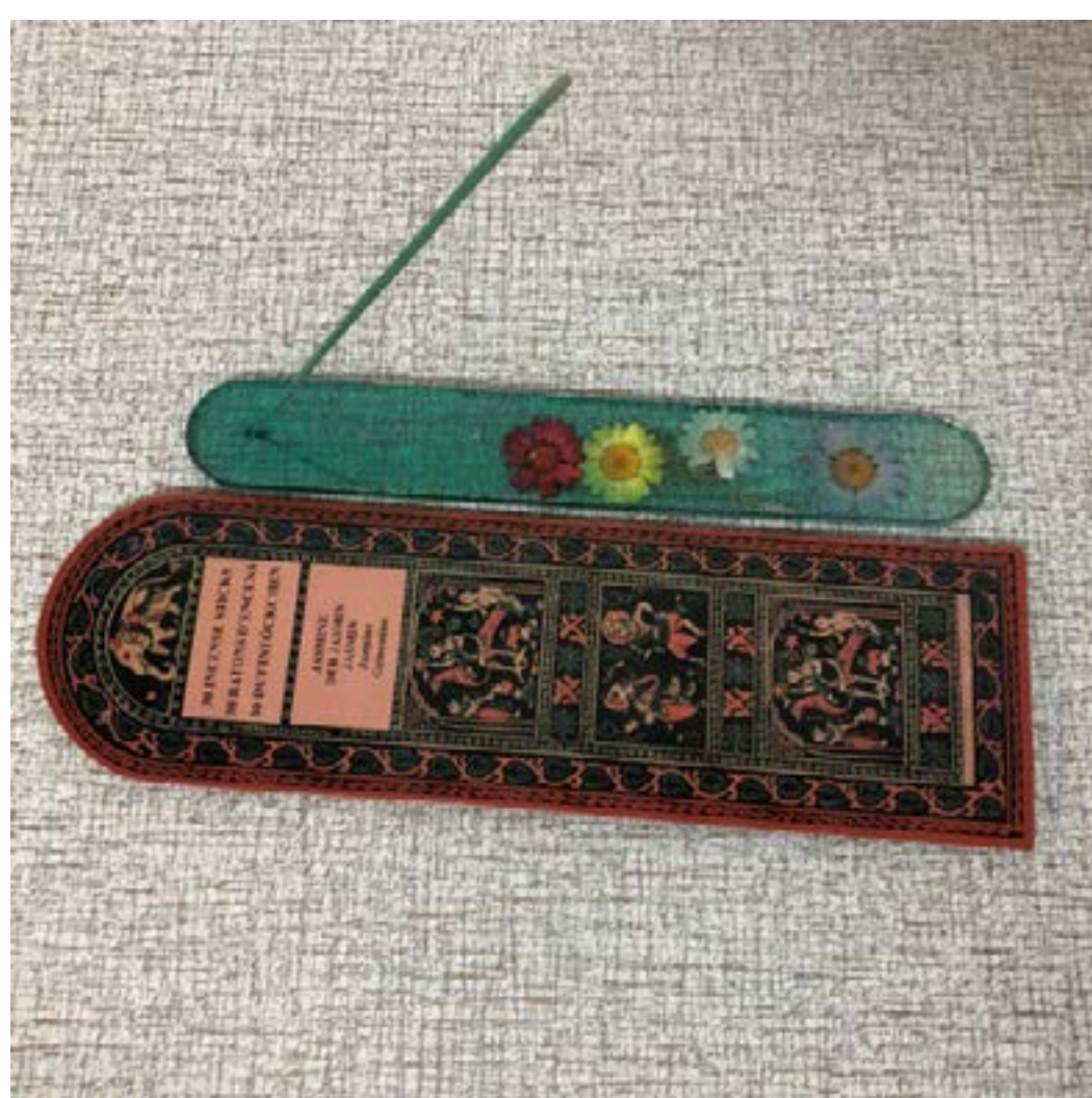
Pack Incienso 5€ Ud.