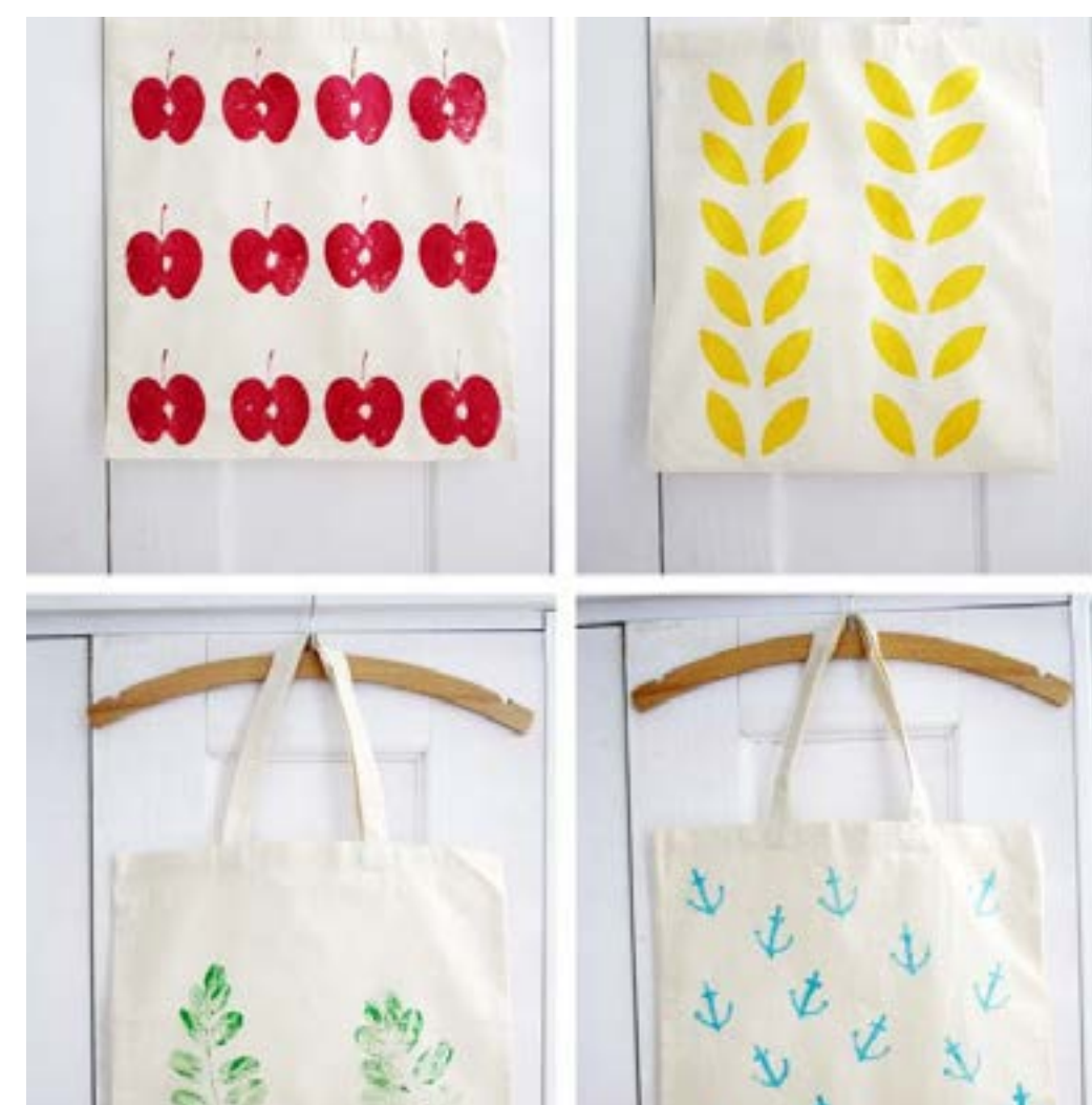
Bolsas estampadas 5€ Ud.