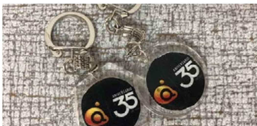
Llaveros personalizados 2€ Ud.