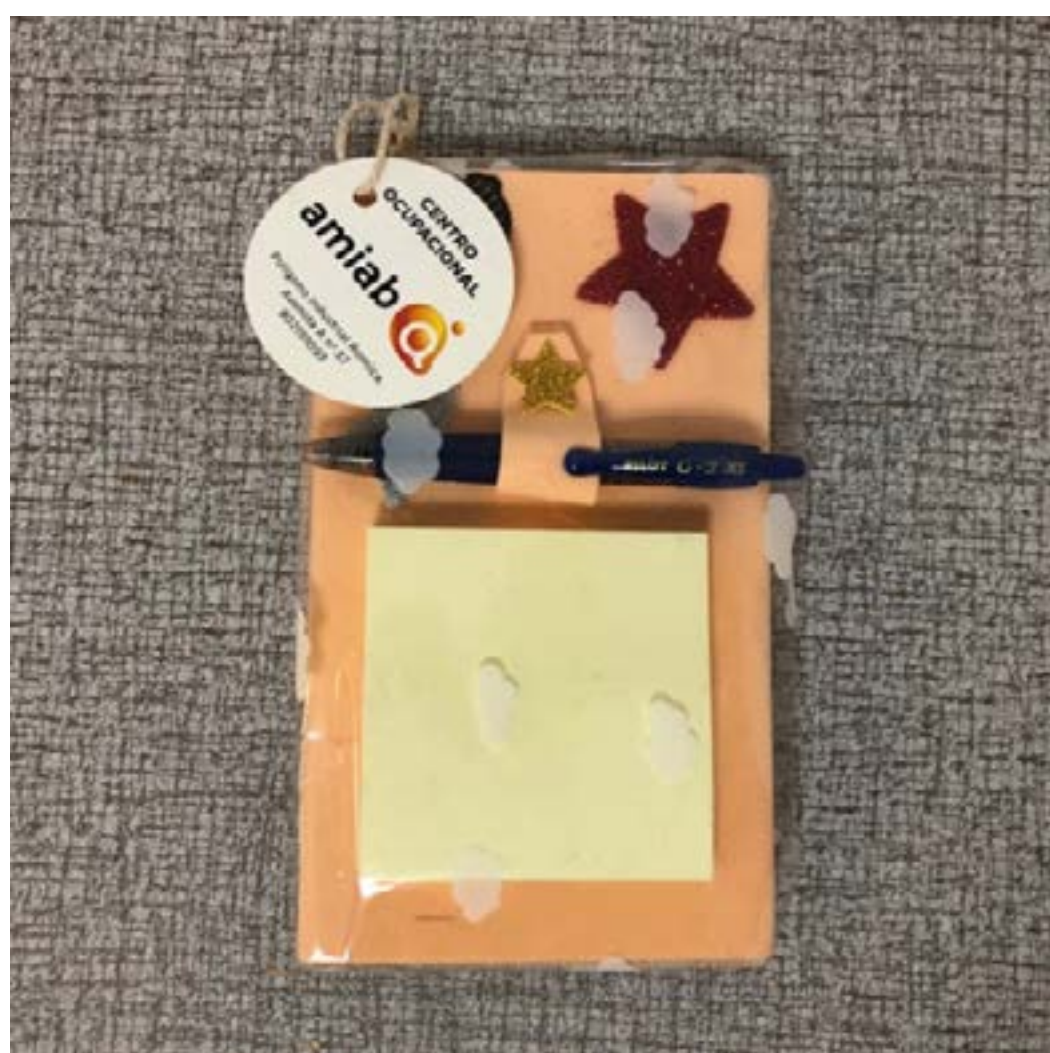
Libreta nevera 5€ Ud.