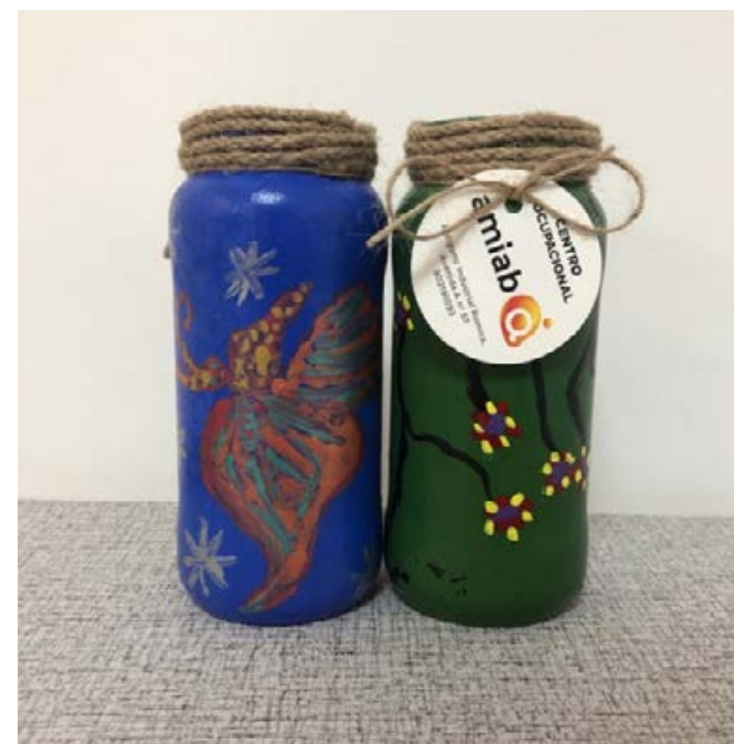
Bote cristal 2€ Ud.