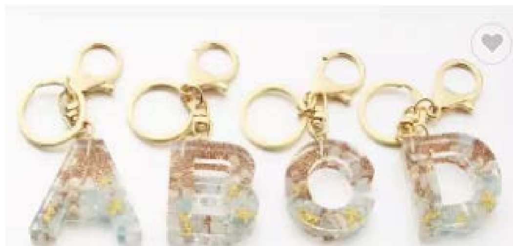
Llavero resina 2€ Ud.