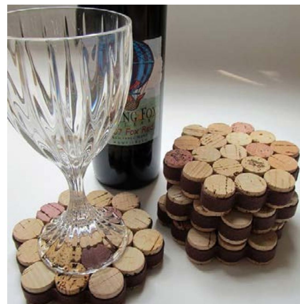
Lote de posavasos